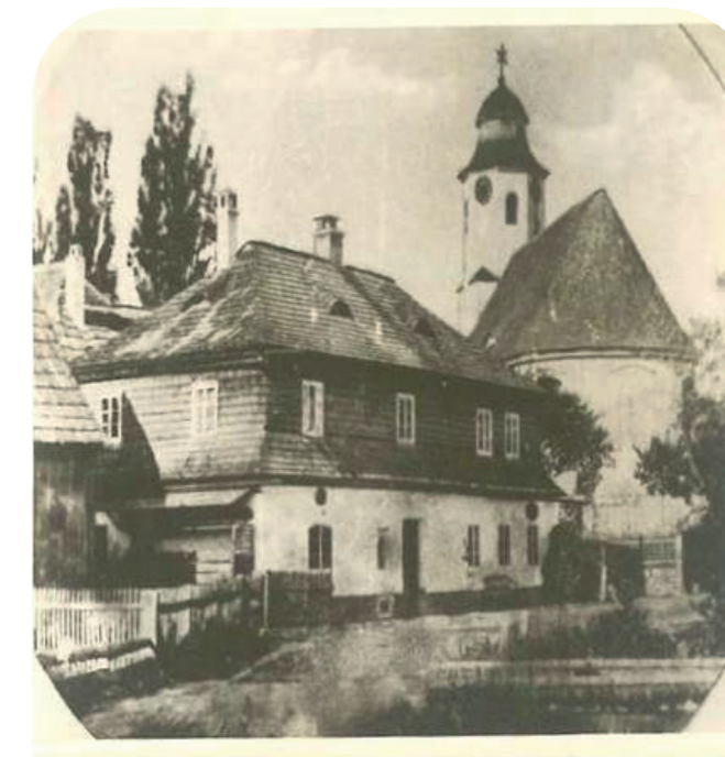
Die Kirche zu Dittersbach im Jahre 1885 (im Vordergrund Gasthof u. Fleischerei Joarich nach dem Krieg abgerissen)