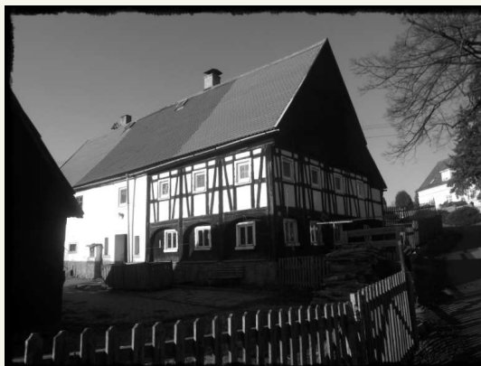
Památkově chráněné č.p.67, nad silnicí jeho vejminek č.p.68